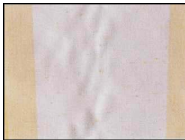
Rynker midt på en dugbane.